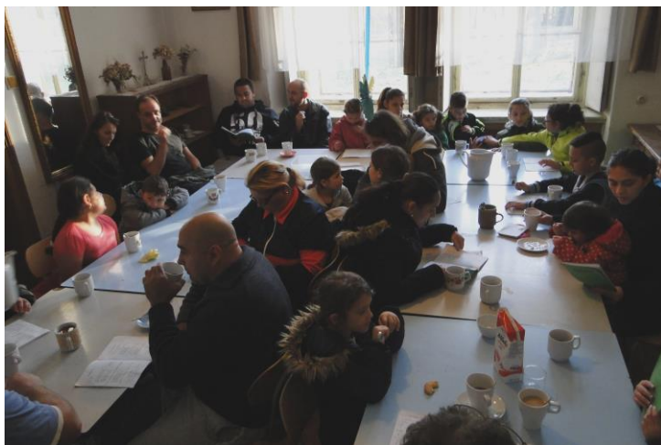
Foto z romského Alfa vikendu na Knířově.

KOUTEK PRO ZVEDNUTÍ KOUTKU: „Představ si, včera jsem se nemohl celý den odtrhnout od Bible!“ „To sis při čtení Bible zase hrál s vteřinovým lepidlem?“