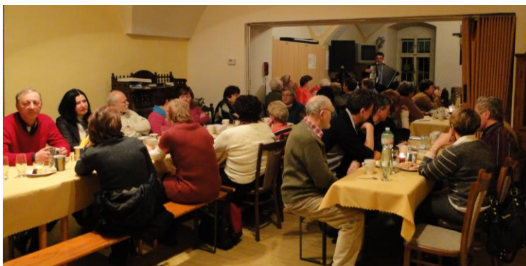
Foto z posezení farníků, kteří se aktivně zapojují do života farnosti

V příštích ohláškách vám představíme paní Jiřinu Lněničkovou.