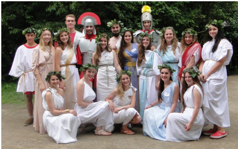
Foto z tábora VRANCE 2016: (fotografie najdete také na webu naší farnosti)