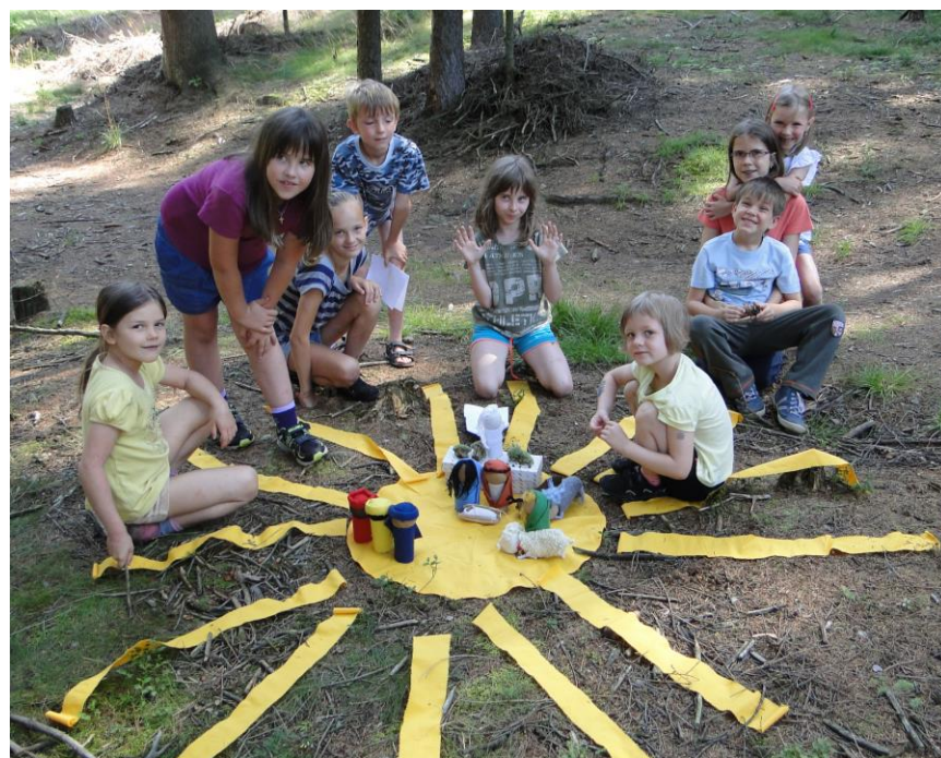
Večer jsme zpívali.