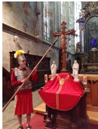
O tom, že z Ježíšova boku vytekla krev a voda nám přišel svědčit na Velký pátek římský voják Longin.

EVANGELIUM: Jan 20,1-9 Prvního dne v týdnu přišla Marie Magdalská časně ráno ještě za tmy ke hrobu a viděla, že je kámen od hrobu odstraněn. Běžela proto k Šimonu Petrovi a k tomu druhému učedníkovi, kterého Ježíš miloval, a řekla jim: „Vzali Pána z hrobu a nevíme, kam ho položili.“ Petr a ten druhý učedník tedy vyšli a zamířili ke hrobu. Oba běželi zároveň, ale ten druhý učedník byl rychlejší než Petr a doběhl k hrobu první. Naklonil se dovnitř a viděl, že tam leží pruhy plátna, ale dovnitř nevešel. Pak za ním přišel i Šimon Petr, vešel do hrobky a viděl, že tam leží pruhy plátna. Rouška však, která byla na Ježíšově hlavě, neležela u těch pruhů plátna, ale složená zvlášť na jiném místě. Potom vstoupil i ten druhý učedník, který přišel ke hrobu první, viděl a uvěřil. Ještě totiž nerozuměli Písmu, že Ježíš musí vstát z mrtvých.