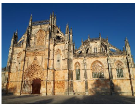
Batalha – Dominikánský klášter