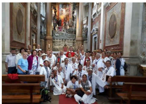
mše sv. v Bom Jesus u Bragy se skupinou poutníků z Tahity