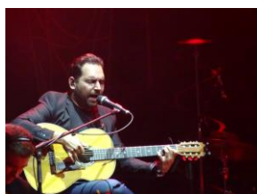
festival Fado v Lisabonu