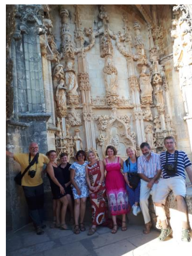
v Tomaru v klášteře Řádu templářských rytířů (ve stylu manuelské renesance)