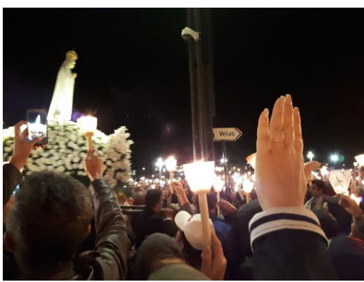
Fatima – noční vigílie s průvodem se sochou Panny Marie