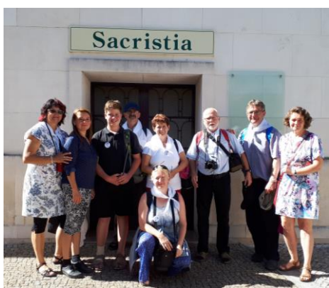
setkání ve Fatimě za kapli Zjevení